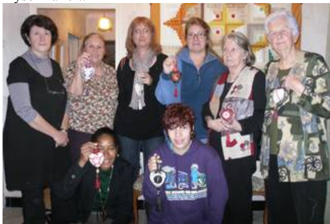
Église réformée du Pays d'Arles