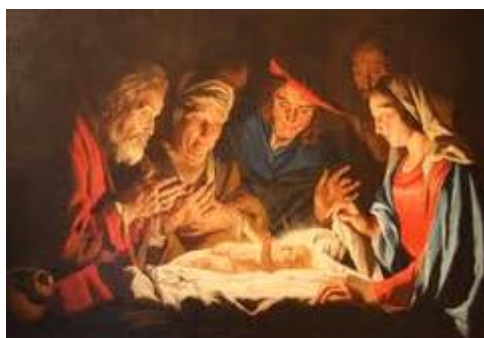
L'adoration des bergers (Matthias Stomer)

Bien au contraire !! Jésus est né dans un temps comme le nôtre et, malgré cela, il a su apporter le plus essentiel : une parole d'amour et de réconciliation. Jésus a su transformer les esprits et les orienter sur la seule voie possible : se tourner vers notre frère. Jésus a su faire comprendre aux hommes que le seul combat à mener est la lutte contre toute forme de discrimination ou de rejet de l'autre, notre prochain comme notre lointain.