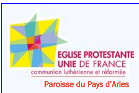
2 logos possibles officiellement pour EPUPA